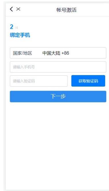
移动端绑定手机页面