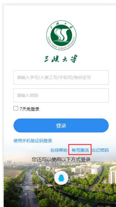
移动端账号激活页面