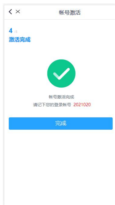
移动端激活完成页面

6. 第三方账号绑定： 为方便使用，请尽快在 PC 端通过账号密码或者短信验证码登录平台 ( https://ids.ctgu.edu.cn )。点击“第三方账号” -> “立即绑定”，按照提示完成绑定操作。