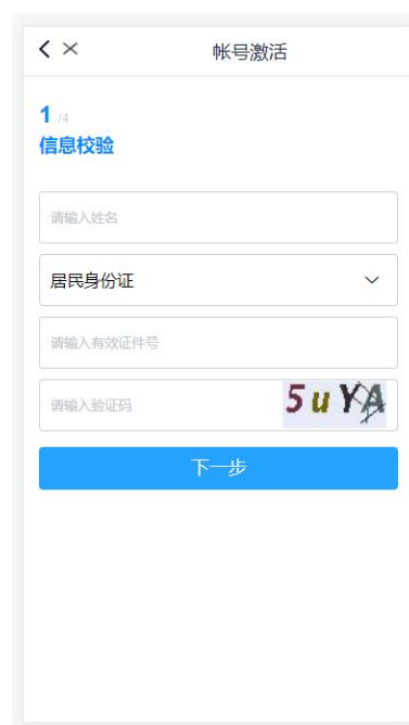
移动端信息校验页面