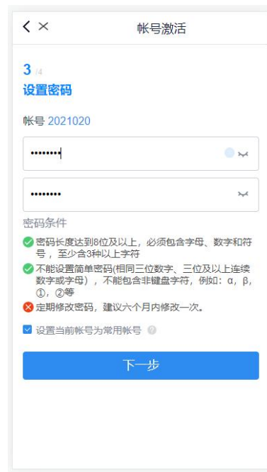
移动端设置密码页面