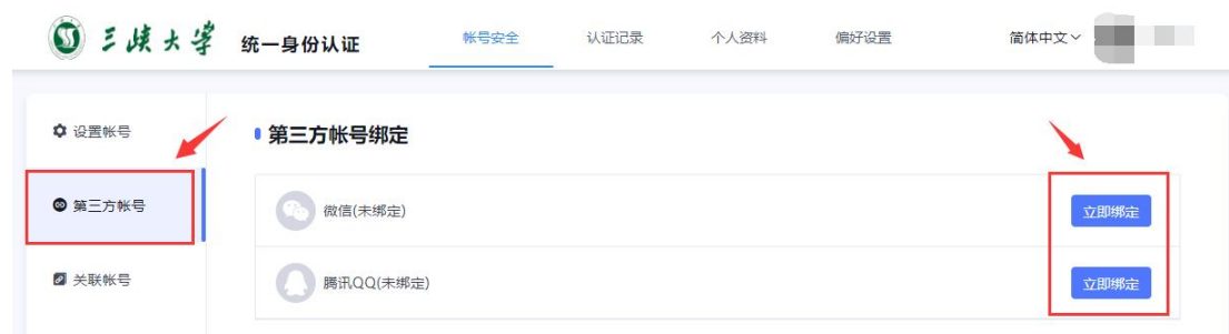
PC 端第三方账号绑定页面

6. 第三方账号绑定： 为方便使用，请尽快在 PC 端通过账号密码或者短信验证码登录平台 ( https://ids.ctgu.edu.cn )。点击“第三方账号” -> “立即绑定”，按照提示完成绑定操作。